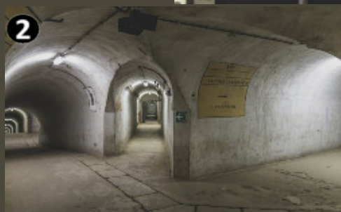
5 km of underground galleries