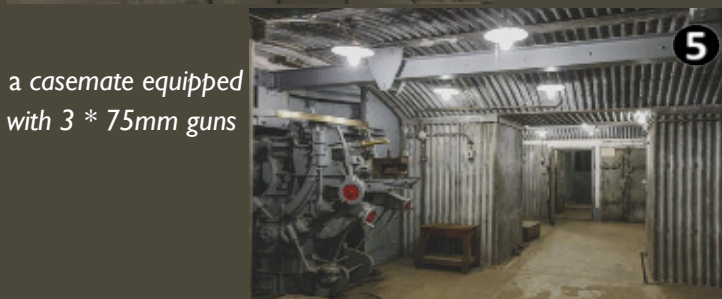
a casemate equipped with 3 * 75mm guns