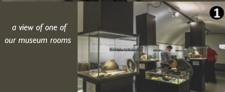
a view of one of our museum rooms