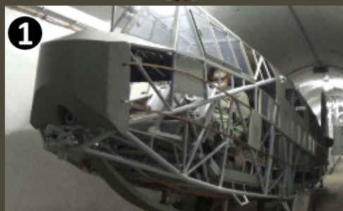
an original DFS 230 glider in exposition